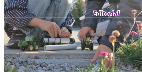
Zeit und Raum, gemeinsam zu spielen und spielend zu lernen sind große Schätze ...

Wo die Kinderbetreuung, wie bei den „Matthäus-Wichteln“ buchstäblich bereits