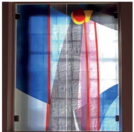
Mittleres Kunstglasfenster: Jesu Tod am Kreuz

Im Bild zum Tod Jesu überwiegen dunkle Farbtöne, und man kann das Kreuz erkennen. Aber auch hier scheint das helle Blau des Himmels hinter dem Dunkel hervor. Die roten Linien, die sich vom roten Kreis – dem Haupt des Gekreuzigten – in dünnen Bahnen nach unten bewegen, sprechen von Wunden und Leiden. Gleichzeitig ist die Farbe Rot das Bindeglied zum ersten Bild und steht auch hier für Liebe, Kraft und lebendige Hoffnung über den Tod hinaus.