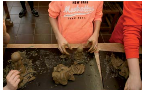
Kreativ sein – die Bibel „kneten“