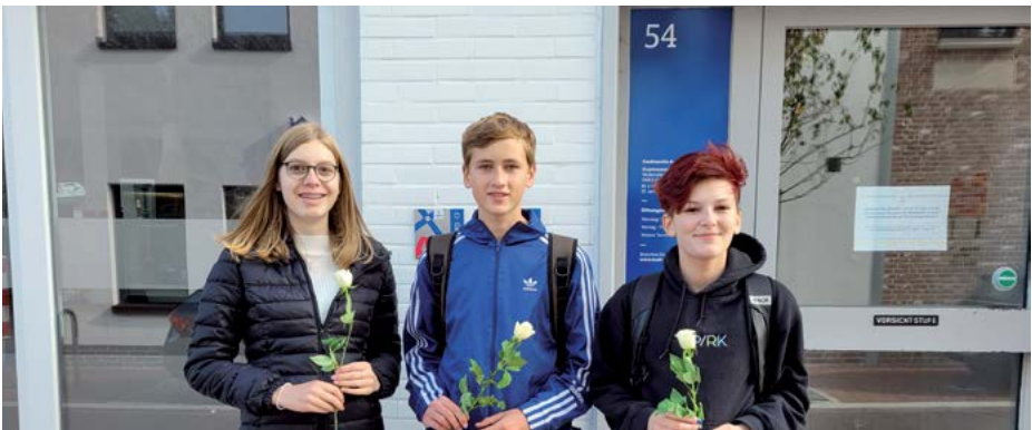
Weißer Rosen für Levy Isaak Wolff

Der Künstler Gunter Demnig erinnert mit seinen Stolpersteinen an das Schicksal der Opfer, die in der Zeit des Nationalsozialismus ermordet, vertrieben oder deportiert wurden. Dazu lässt er Betonsteine mit Gedenktafel aus Messing zur Größe von 10 x 10 cm vor dem Wohnort ins Pflaster des Gehweges ein. Die Steine tragen die wichtigsten biografischen Daten. Mittlerweile liegen etwa 90.000 Steine in Deutschland und weiteren europäischen Ländern.