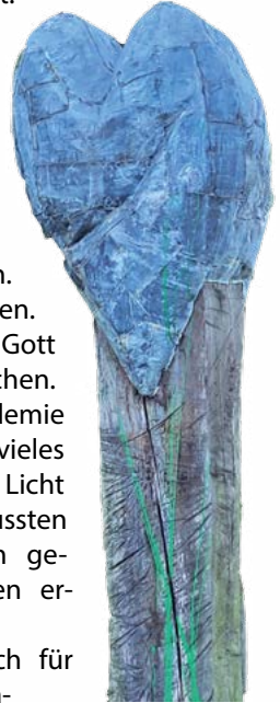
Baum mit Herz – Skulptur von Uwe Schloen, Theaterplatz Göttingen

Und er hat dem Ganzen eine Krone aufgesetzt, eine Herzkronen – nicht wirklich schön; sie ist aus Blei und nicht aus Edel-