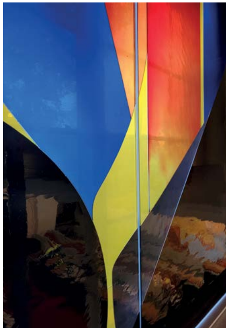
Hinteres Kunstglasfenster: Auferstehung

Wieder aufgenommen wird das Rot dann auch im dritten Bild, das von Ostern, von der Auferstehung erzählt. Das Dunkel unten im Bild stellt das Grab dar, aber der Fels davor ist weggewälzt, und Licht fällt ins Dunkel. Aus dem Grab steigen kraftvoll zwei rote Bahnen und verbinden Himmel und Erde, das Blau wird nach oben hin heller.