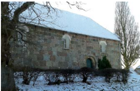
Kirche zu Asel im Schnee

Wir freuen uns schon! Silke Kampen und Ulrich Menzel