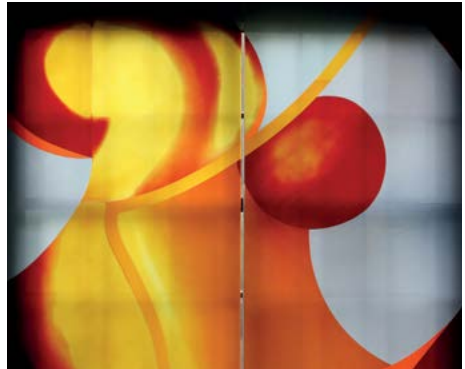
Vorderes Kunstglasfenster: Jesu Geburt

Im Bild zur Geburt dominiert die Farbe Rot als Farbe der Liebe, der Kraft, des Blutes, des Lebens, der Wärme, der Aktivität und der Leidenschaft. Mit der Farbe Gelb strahlt Licht durch das Bild. Das Blau steht für den Himmel. Die runden Formen weisen auf die Ewigkeit hin – ohne Anfang und Ende. Groß und Klein deuten auf das Verhältnis von Mutter und Kind hin, die noch verbunden, aber in der Loslösung