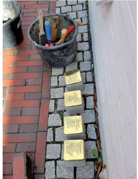
Kurz vor der Verlegung ...

Im Rahmen der 16. Verlegung der Stolpersteine sind vier Stolpersteine für Levy und Frida Wolff und deren Kinder Renate und Günther in der Wallstraße 54 verlegt worden (vgl. Foto).