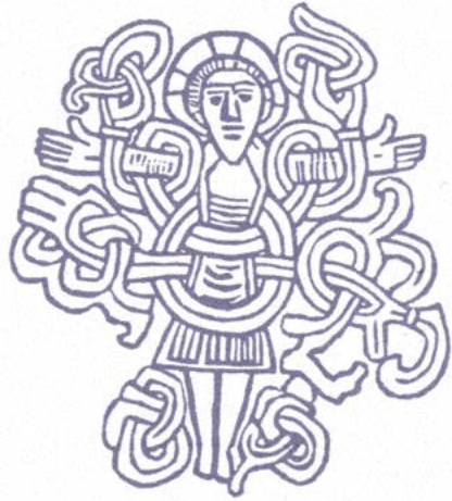
Lebendiger gekreuzigter Christus – Passion und Ostern in einem Bild aus Dänemark – ein sog. Baumkreuz der Astrup-Kirche bei Åhus

Wenn Sie noch mehr Bewegung benötigen, freuen wir uns, Sie als Gemeindebriefausträgerin oder –träger begrüßen zu können. Alle drei Monate in einigen Straßen den Matthäus-Kurier in die Briefkästen zu stecken, hilft uns, die Gemein-